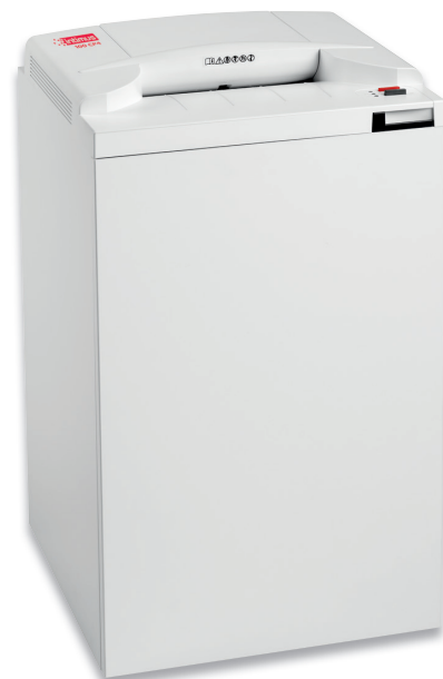
A/P/H 49 x 44 x 90 cm